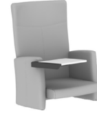
ANITTA S1 KONFYZTABLALI