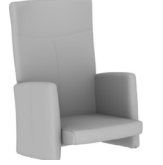
ANITTA S0 KONFYZTABLASIZ