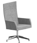
ANITTA S2 VISITOR HIGH CHAIR