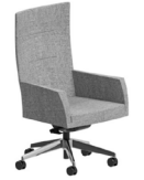
ANITTA S2 EXECUTIVE HIGH CHAIR